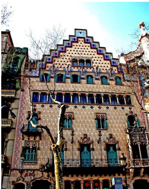
Façana de la Casa Ametller

El nom de l'edifici és Casa Ametller. Està situada al Passeig de Gràcia, 41, 08007 de Barcelona. L'arquitecte que la va construir va ser Josep Puig i Cadafalch per un encàrrec d'un industrial xocolater anomenat Antoni Amatller Costa.