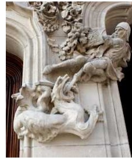
Capitel/ escultura de la façana

Al voltant de la Casa Atmetller trobem la Casa Batlló. També és un edifici modernista, però aquest és evolucionat casi expressionista i al estar un al costat de l'altre, és veu un alt nivell de contrast que fá que no encaixan bastant bé. Respecte al edifici de l'altre costat, encaixa una mica més, ja que el color és molt semblant, però just en aquell edifici trobem un restaurant de menjar ràpid amb taules al mig del carrer traient-li prestigi. En general, en la zona on està situat, l'edifici encaixa perfectament al estar en el centre de la ciutat.