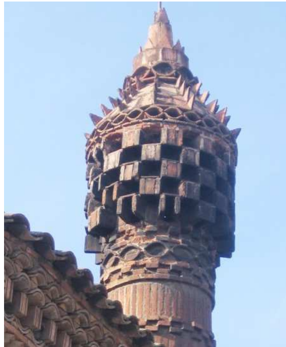
Una de les xemeneies

De la construcció destaquen també les cantonades arrodonides i la filigrana del treball amb maó de les finestres i les tres xemeneies.